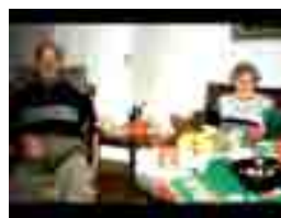
var mormor och morfar.