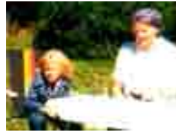
På ett torkstreck hänger min nytvättade klänning. och solen skiner. Jag var bara två år vid detta tillfälle och inget speciellt hände men jag kommer ihåg den här stunden fortfarande.