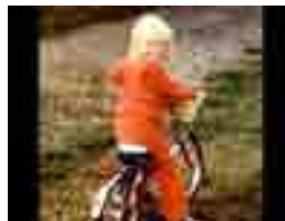
cykla och bara njuta av livet. De som lärde mig allt det här