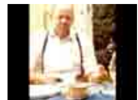
Morfar var den store, starke och hjulbente bonden som alltid berättade historier för oss.

Intro med musik Mitt första minne här i livet är när jag och min mormor sitter på trappan till det gula huset. På ett torkstreck hänger min nytvättade klänning. och solen skiner. Jag var bara två år vid detta tillfälle och inget speciellt hände men jag kommer ihåg den här stunden fortfarande. Ända se jag var liten har jag och min bror varit här varje sommar. Det var här jag lärde mig att mata höns, plocka blåbär, cykla och bara njuta av livet. De som lärde mig allt det här var mormor och morfar. Morfar var den store, starke och hjulbente bonden som alltid berättade historier för oss.