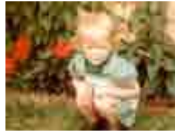
Mitt första minne här i livet är när jag och min mormor sitter på trappan till det gula huset.