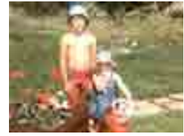
Ända se jag var liten har jag och min bror varit här varje sommar. Det var här och lärde mig att mata höns, plocka blåbär,