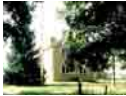
Intro med musik

Här följer ett bildmanus som är gjort med bilder till den text du läste tidigare.